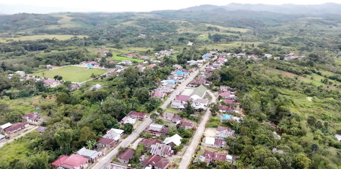
Gambar 4: Pemukiman Wanua Watutau (Desa Watutau)

masyarakat terhadap sumberdaya hutan (Bromley 1989) dan Hamzah et al (2016) menyatakan bahwa batas pengelolaan antara hutan olahan simpanan, dan larangan yang disepakati bersama; adanya aturan main terhadap kewenangan pemanfaatan; dan saksi yang jelas dalam penegakan aturan. 22 Demikian halnya di wanua watutau , Hutan Primer seperti Wana Ngkiri/Wumbu Wana , Wana dan Pandulu terdapat aturan adat yang tidak memperbolehkan membuka lahan perkebunan, jika dilanggar akan diberi sanksi berat. Sementara di areal Hutan produksi seperti Lopo , Pampa dan Holua tidak diperbolehkan membuka lahan tanpa izin pemilik sebelumnya. Bila seseorang membuka lahan di areal tersebut harus meminta izin kepada pemilik sebelumnya. Jika terjadi pelanggaran, maka akan diberi sanksi adat sesuai tuntutan pemilik lahan. Begitu pula di areal penggembalaan ternak ( Pada ) tidak diperbolehkan membuka lahan perkebunan, penguasaannya bersifat komunal tidak dapat dipindah alihkan.