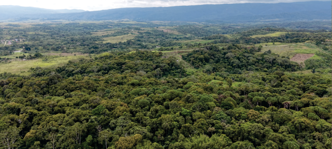
Gambar 2: Hutan dan Kebun Wanua Watutau

produksi sebagai zona pemanfaatan untuk ladang atau kebun rotasi yang terdiri dari lopo , pampa dan holua yang masih digarap atau sudah ditinggalkan hingga 10-25 tahun. Pemanfaatannya sebagai sumber pangan (padi ladang, ubi kayu, pisang, sayuran serta rempah-rempah).