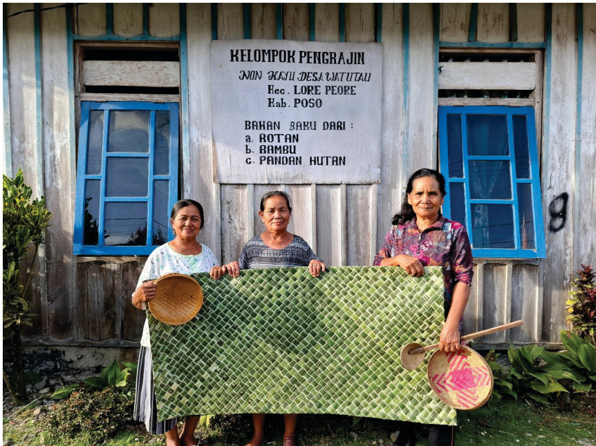
Gambar 5: Kelompok Pengrajin Hasil Hutan Bukan Kayu

Masyarakat hukum adat merupakan sekelompok manusia yang memiliki tata susunan tetap, memiliki pengurus, harta benda dan bertindak sebagai satu kesatuan terhadap dunia luar yang mendiami suatu wilayah (Soepomo, 2000). Pranata adat mencakup lembaga dan aturan yang dipergunakan oleh masyarakat hukum adat dalam menciptakan tata kehidupan masyarakat yang tertib, aman dan teratur. Aturan ini terdapat dalam masyarakat hukum adat yang bentuknya tidak tertulis. 23 Lembaga Adat to Pekurehua Wanua Watutau disebut Topolemo Ada . Adapun berdasarkan kriterianya, Topolemo Ada diisi oleh kalangan Kabilaha yang banyak mengetahui tentang hukum adat, peradilan adat serta dipilih berdasarkan garis keturunan kalangan Kabilaha pula. Pembagian peran