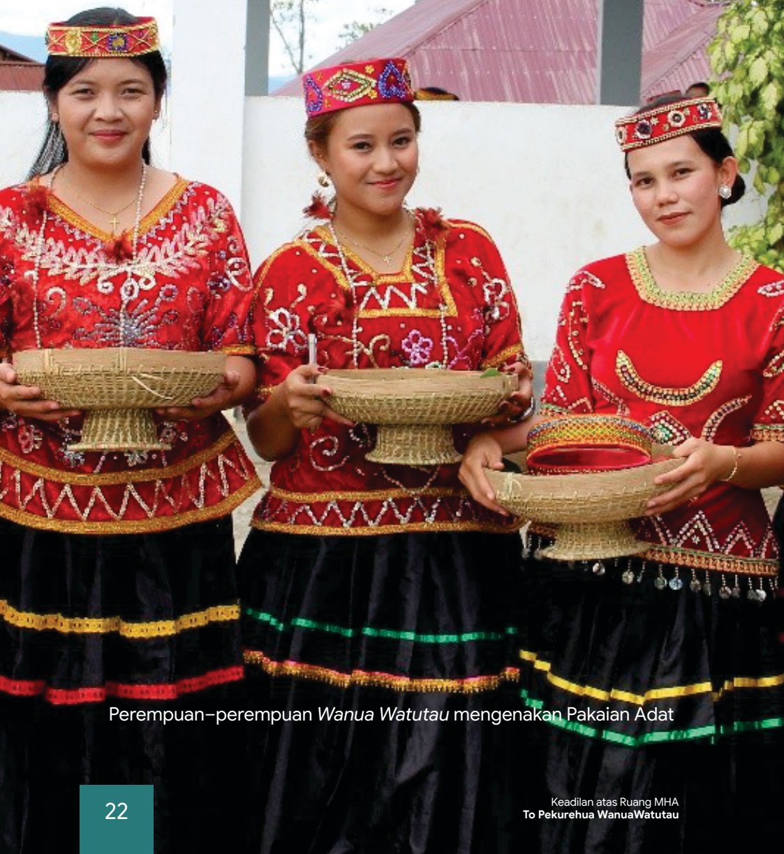
Perempuan-perempuan Wanua Watutau mengenakan Pakaian Adat