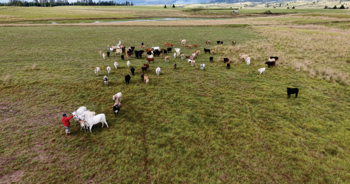
Gambar 3: Padang Penggembalaan Sapi Wanua Watutau

“Poti mata” ( Macaranga mappia (L.) Mull.Arg. 21 Nama-nama tempat area persawahan atau bonde keowai di wanua watutau antara lain bengki, tadara, pekurehua, timpopo, pangka, wurangka dan papambuhu . Sebagian besar wilayah persawahan ini tidak memiliki pengairan atau irigasi namun bersifat tadah hujan. Ritual adat mobusa hinawu dilakukan pada masa tanam sementara mohambe untuk masa panen.