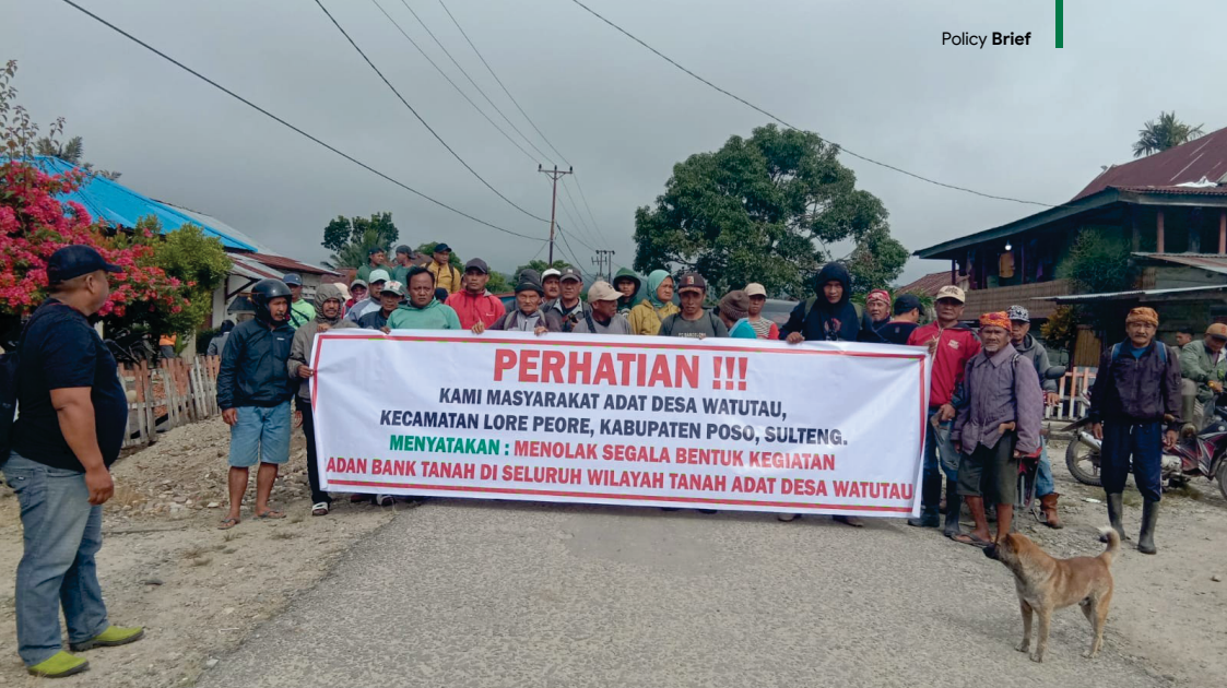
Gambar 9 : Protes Masyarakat Adat Wanua Watutau terhadap Badan Bank Tanah