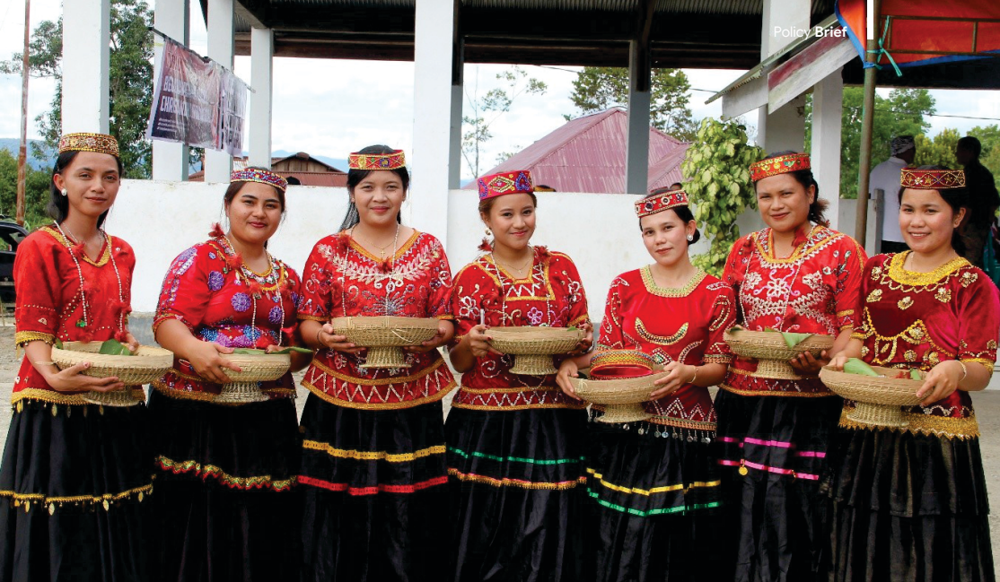
Gambar 6: Perempuan-perempuan Wanua Watutau mengenakan Pakaian Adat

dalam Lembaga adat terdiri dari tadulako (ketua), topehuga (wakil ketua), guru tulisi (sekretaris), topamboli (bendahara), topehuga mantuleli (Humas). Beberapa jenis pelanggaran adat antara lain sala mata (pelanggaran mata), sala hume (pelanggaran mulut), sala taye (pelanggaran tangan), sala uma wata (pelanggaran seluruh tubuh). Selain itu, hukum adat yang masih dijalankan hingga saat ini antara lain hukum adat perkawinan, kematian, penanaman, pergaulan dan lainnya.